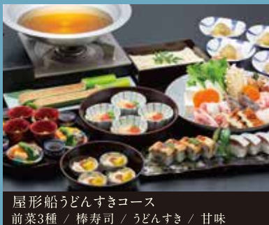
屋形船うどんすきコース 前菜3種 / 棒寿司 / うどんすき / 甘味