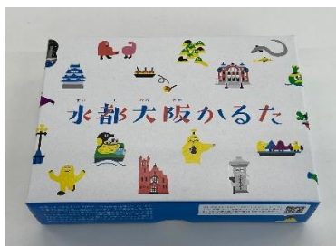
水都大阪かるたケース