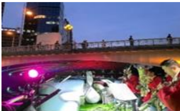
参考：(3) 音楽パフォーマンス船(イメージ)