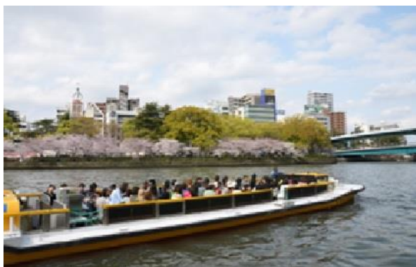
参考：(4) プラごみ集めて船を走らせよう！で使用するクルーズ船