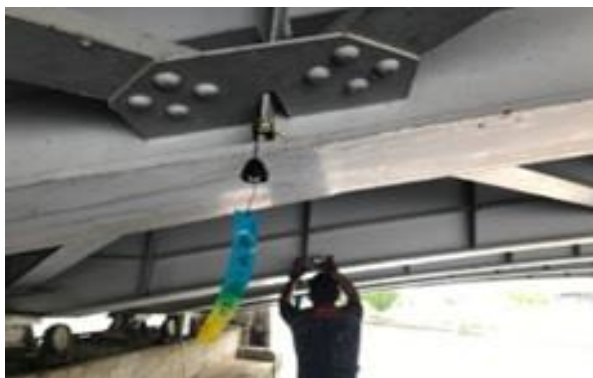
参考：(2) 水上の風鈴めぐり(イメージ)