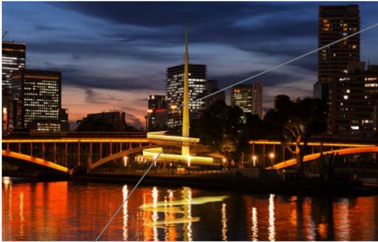
支柱ライトアップ