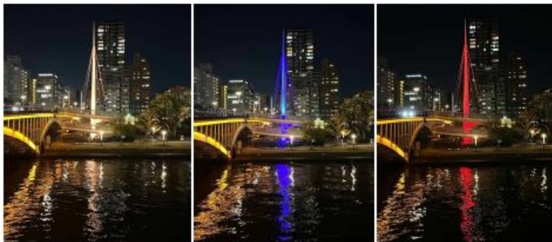
↑塔ライトアップ照射実験時の様子