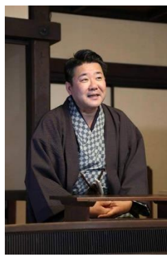
笑福亭 純瓶 (しょうふくてい じゅんぺい)