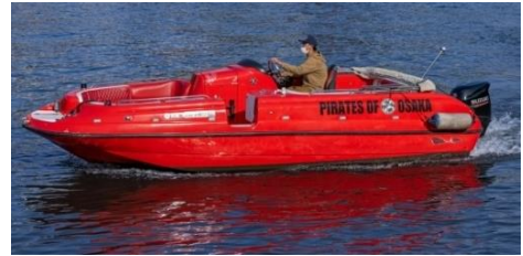
屋根のない小型船で風を切ってクルーズ