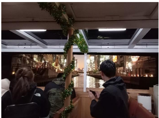
道頓堀の夜景を眺める参加者