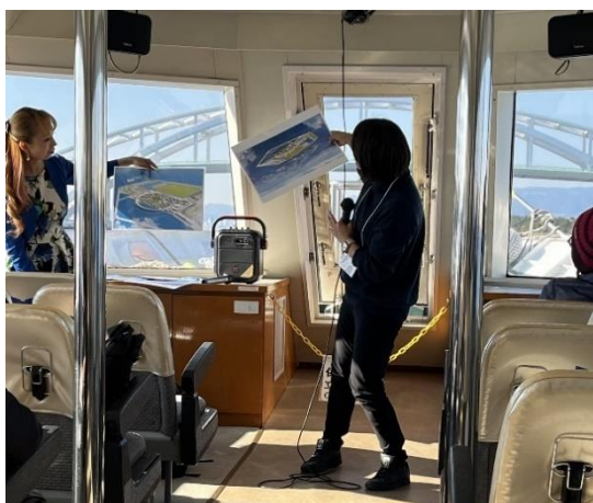
夢洲へ向かう船内風景