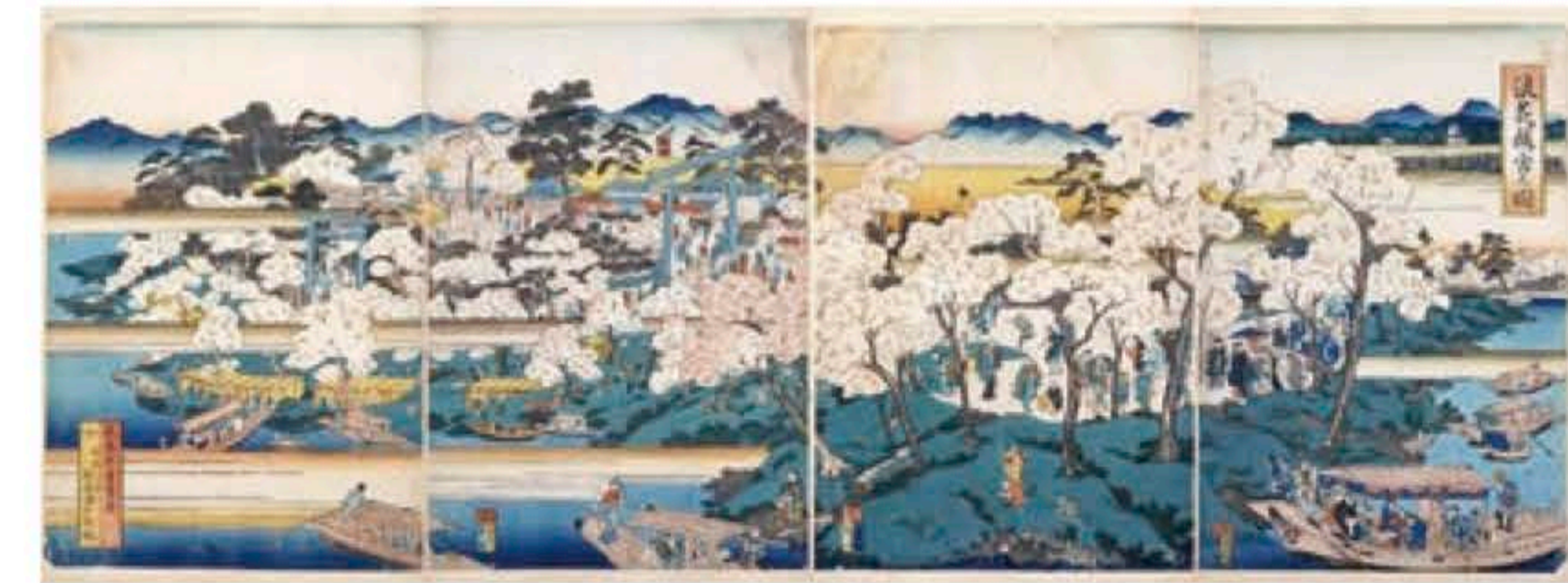
横高是日本最古老的赏樱胜地，无论从陆路还是水路都可尽享樱花美景。(出处：锦绘《浪速横高之图》绘：龟寿亭贞芳/国立国会图书馆数图收藏)