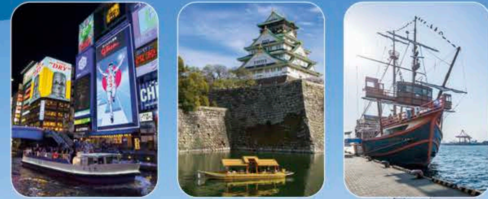
발행 : 물의 도시 오사카 컨소시엄 [2024.9]

물가의 볼거리 명소 크루즈로 즐기는 '오사카의 물가 경치'는 계절마다 다양한 표정을 보여줍니다. 다양하고 풍부한 경치의 일부를 소개합니다.