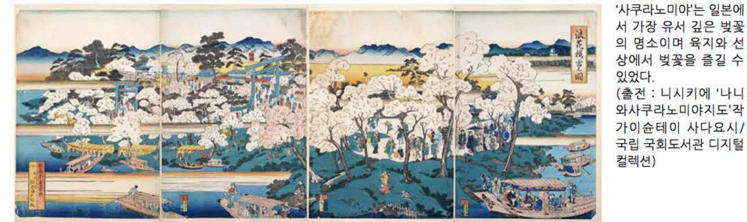
'사쿠라노미야는 일본에서 가장 유서 깊은 벚꽃의 명소이며 육지와 선상에서 벚꽃을 즐길 수 있습니다. (출전 : 니시키에 '나니와사쿠라노미야지'작가 이순테이 사다요시/국립국회도서관 디지털 컬렉션)

활용했습니다. 히데요시 사후도 도시 만들기 사업은 계속되어 상인들이 개척한 호리카와 강이 마치 모세혈관처럼 온 도시에 뻗어 17세기 중순에는 오사카는 물의 도시로서 전성기를 맞이하게 됩니다. 나카노시마에 일본 전도의 영주 '번'의 창고 겸 저택인 '구라야시키'가 출몰이 지어지고 쌀 등 각지의 산물이 반입되면서 오사카는 '천하의 부엌'이라 불리게 되었습니다. 또한 일본의 내해 '세토나िका이', 동해 (일본해), 태평양을 순환하는 상업 선박 '기타마에부네'의 항로가 개발되면서 오사카는 일본 최대의 물류 거점이 되었습니다. 오사카와 교토를 연결하는 대동맥으로서 덴마바시, 하치켄야마하부 교도의 후시미까지 '산치코쿠부네 (30척 선)'가 수시로 왕래한 요도가와 강은 전성기에는 하루 320편, 9,000명의 사람이 왕래했다는 기록이 있습니다. 오사카 백경을 그린 우키요에 풍속화 '나니와와켓이'에는 다양한 물가의 풍경이 그려졌습니다. 수많은 마을 다리가 설치된 모습은 '나니와 팔백팔교'라 칭해졌습니다. 물기가 있는