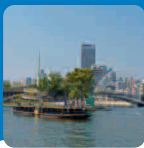
劍先噴泉 (中之島公園)