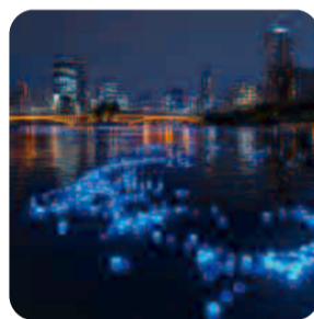
令和大阪天河傳說 (7/7)