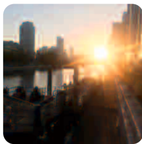
來光咖啡屋 (淀屋橋)