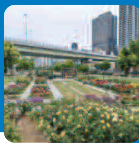
玫瑰園 (中之島公園)