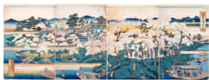
櫻宮是日本最古老的賞櫻勝地。無論從陸路還是水路都可盡享櫻花美景。(出處：錦繪《浪速櫻宮之圖》繪製者：春草良方/國立國會圖書館藏)