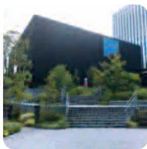
大阪中之島美術館