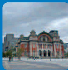
大阪市中央公會堂