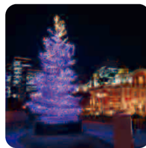
河畔的象徵樹 (中之島公園水上劇場前)