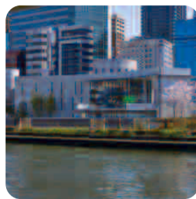
兒童圖書森林 中之島