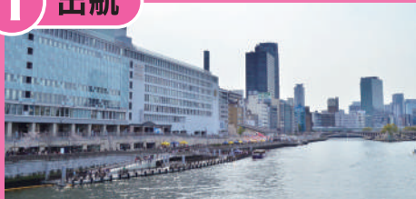
八軒家浜船着場 (はちけんやはまふなつぎば)

「大川さくらクルーズ」ののりばです。八軒家浜は昔から船がたくさん行き交う場所でした。今も色々な種類の船がこの船着場から出航しているよ!