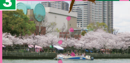
造幣局 (ぞうへいききょく)

「桜の通り抜け」でも有名な造幣局。100円玉や10円玉などの硬貨をつくっているよ。