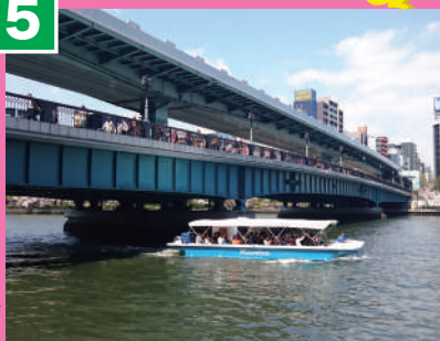
天満橋 (てんまばし)