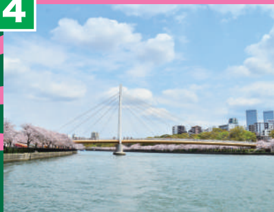
川崎橋 (かわさきばし)