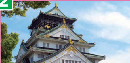
大阪城 (おおさかじょう)

大阪のシンボル、大阪城。船から見える景色の中でもオススメのスポットです! 水の上から見える立派な大阪城をみんなも見てみよう!