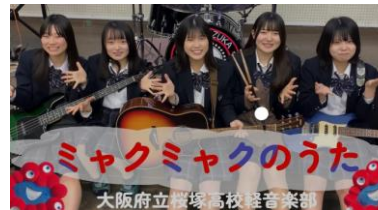
桜塚高校軽音楽部が制作した 「ミyakミyakのうた」