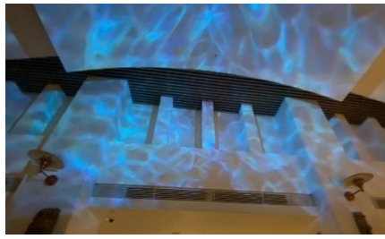
ムービングライト(イメージ)