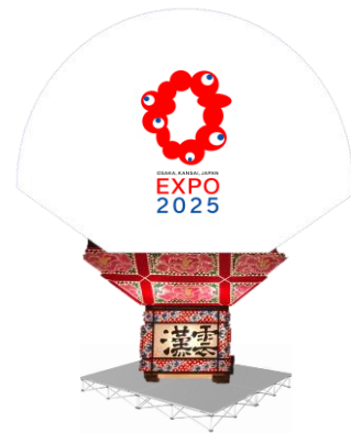
大阪・関西万博ロゴねふた(イメージ)