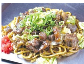
ぼっかけ焼きそば