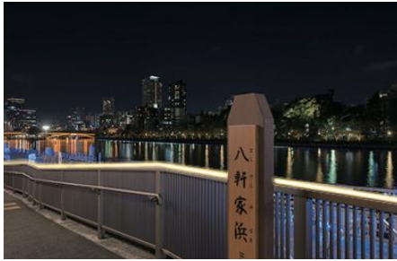
チューブライト(イメージ)