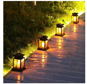
ランタン(イメージ)