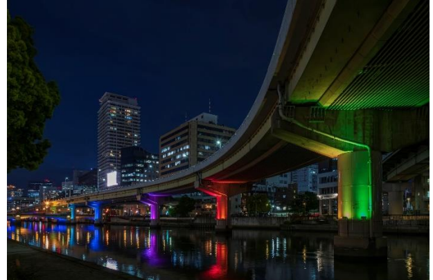
ライトアップの様子