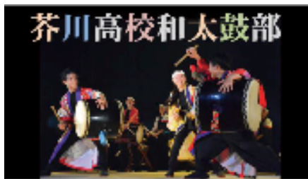
芥川高校和太鼓部 和太鼓ライブ (部員 36 名による和太鼓)