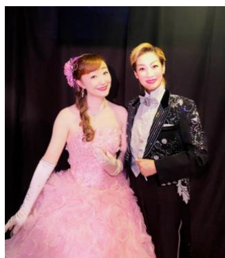
鳴海じゅん、穂穂えりな (元・宝塚歌劇団の歌と踊り)