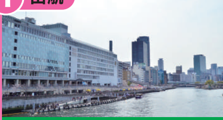
八軒家浜船着場 (はちけんやはまふなつぎば)

「大川さくらクルーズ」の発着場所である八軒家浜船着場は、かつては京都・伏見と大坂を結ぶ舟運の拠点となる場所でした。周辺に八軒の船宿があったことから「八軒家浜」と呼ばれるようになりました。