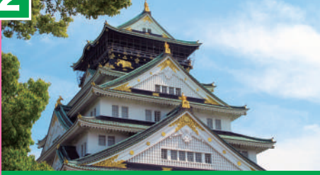
大阪城 (おおさかじょう)

大阪のシンボル、大阪城。クルーズ中にも何度か見ることができ、ビルの後ろから出てきたり隠れたりする姿はとて愛らしく感じます。また、八軒家浜船着場から大阪城天守閣までは歩いて30分程かかりますが、乗船後に春を感じながらのお散歩はいかがですか。