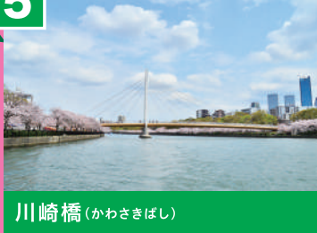
川崎橋 (かわさきばし)

人と自転車のみが通行できる斜張橋。斜張橋とは塔から斜めに張ったケーブルで支えている橋のことです。