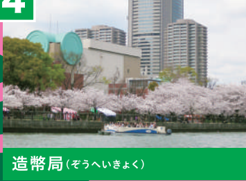
造幣局 (そうへいきょく)

1871年4月に創業した、日本の硬貨を作る場所です。特徴は、建物外観にある緑の丸。これは硬貨をイメージしたものと言われています。