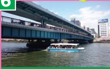
天満橋 (てんまばし)

大阪のまちにとって重要で、親しみのある橋「浪華三大橋」の一つ。渋滞緩和の為に、2階建ての構造になっており、大阪では珍しい形の橋です。